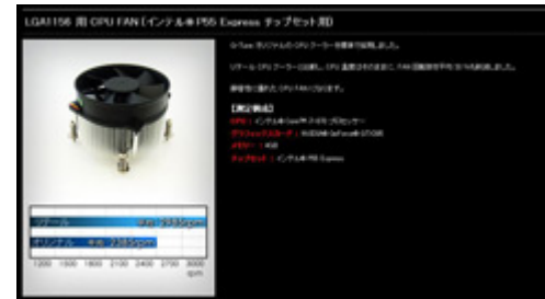
ケース特長 / 冷却FAN特長

ベンチマークデータは、グラフィックボードにフォーカスして、G-Tune独自の計測を実施したものとなります。今後主流となるFullHDの液晶を使用したゲーミング環境を想定した計測となっております。