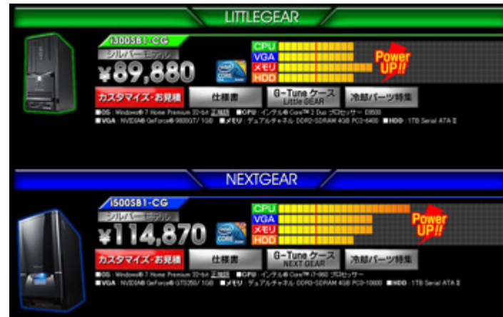
旧:ゲーム推奨パソコンページ / 新:ゲーム推奨パソコンページ