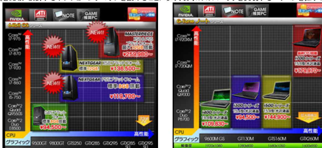
デスクトップパソコン対応表 / ノートパソコン対応表

CPUとグラフィックの性能の関係から製品を比較・検討するポジショニングマップを設けることにより、お求めのスペックを実現するパソコンを探すことが容易になりました。