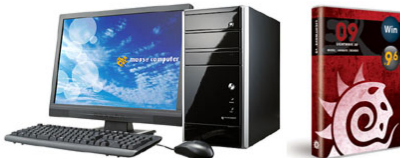
(左)Lm-i451S-WS-LW(モニター別売り) (右)LightWave v9 9.6パッケージ外観

～ 推奨記念特別モデルとしてLightWave v9 9.6バンドルモデルを187,950円からご提供 ～ 2009.03.13