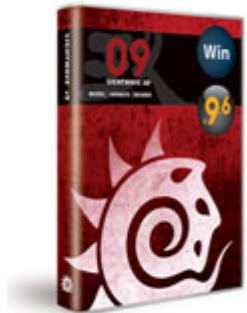
◆LightWave® v9 9.6パッケージ外観