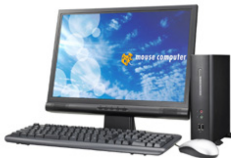
「LM-mini100SC」 (モニター・キーボード・マウス別売り)

株式会社マウスコンピューター(代表取締役社長:小松永門、本社:東京都、以下マウスコンピューター)は、法人向けPCシリーズに、低消費電力を実現するVIA C7®ファンレスプロセッサを搭載したスリムMini-PC「LM-mini100SC」を販売開始いたします。