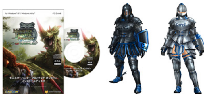
(左)ピクチャーレーベル仕様オリジナルインストールディスク