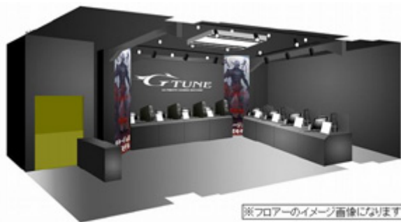
※フロアのイメージ画像になります