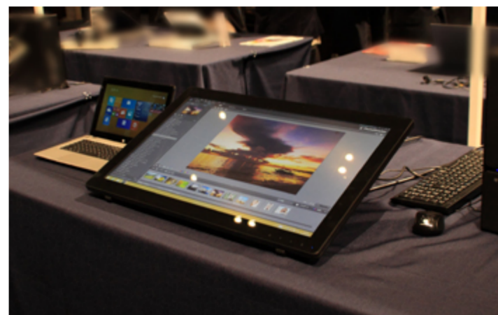
iiyama ProLite T2735MSC-B1 27型10点マルチタッチ対応マルチタッチ対応AMVA+方式を採用したフルHD液晶 スタンドにて自由に角度を変える事が出来ます