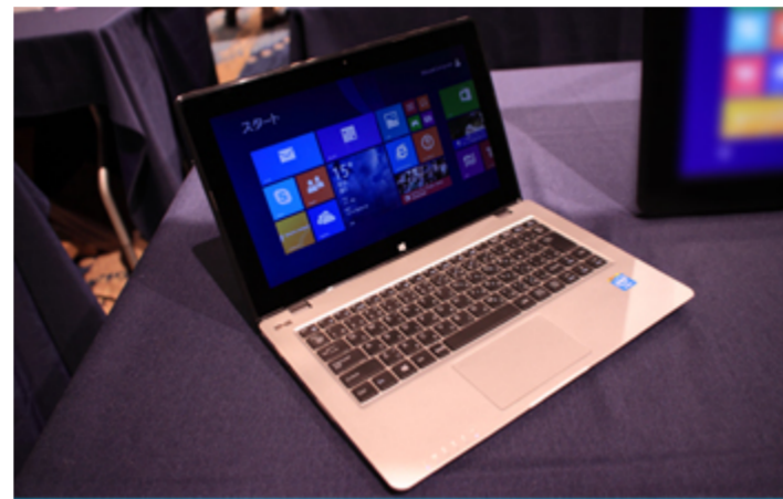
マウスコンピューター LuvBook-Cシリーズ 10ポイントタッチパネル対応 11.6型モバイルノート