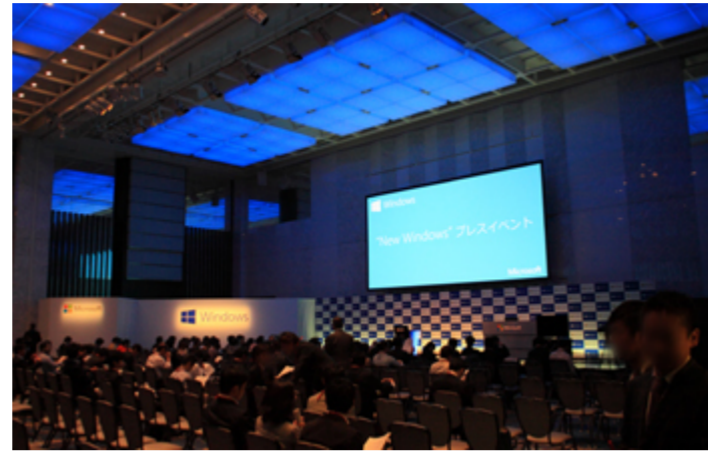
"New Windows" プレスイベント会場写真

2013年10月18日、都内で、Windows8.1発売にあわせて開催された"New Windows"に参加。こちらのイベントにて、マウスコンピューター製品が展示されましたのでレポート致します。