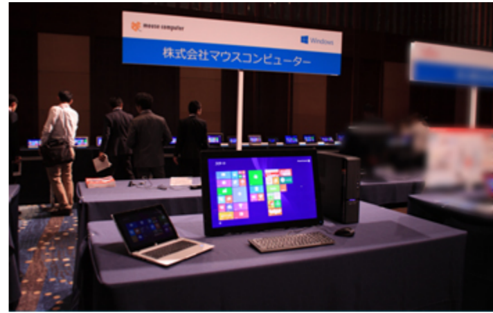
Windows 8.1 がプリインストールされた新製品を展示。マウスコンピューター LUVMACHINES Slim iHS200Xシリーズ iiyama製 10ポイントマルチタッチ対応27型液晶