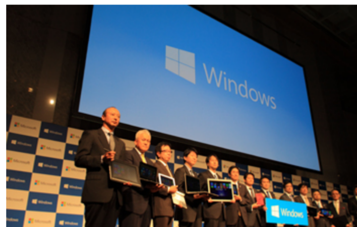
代表者によるWindows 8.1 搭載製品登壇