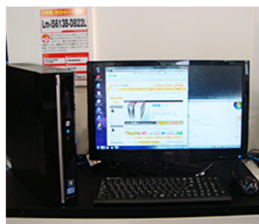
Lm-iSシリーズ、地デジ+iiyamaPLE2273HDS-B1セットモデル