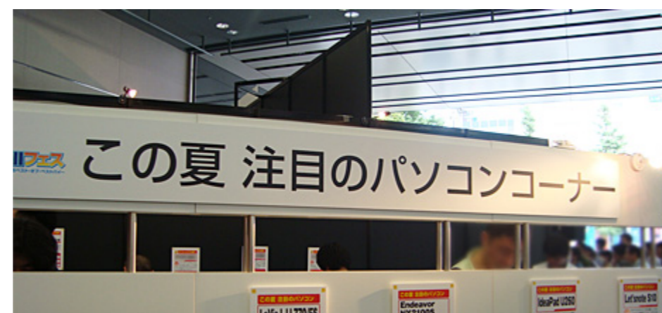
マウスコンピュータ製品が展示されたのはこちら。

2011年6月19日、ベルサール秋葉原で、「週刊アスキーが選ぶベスト・オブ・ベストバイ」をテーマにデジタル製品の博覧会が開催されました。こちらのイベントにて、マウスコンピュータ製品が展示されましたのでレポート致します。