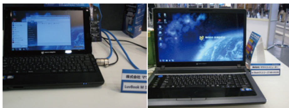
写真左：SSDを搭載した10.1型ワイド液晶を搭載した人気のモバイルノートLB-120S。 写真右：18.4型フルHD液晶を搭載したMB-920S。

JR秋葉原駅から徒歩近く、すぐに巨大なスクリーンが見えて、たくさんの方が覗き込まれていくようでした。多くの著名人やゲストのトークショーが繰り広げられている中で、Windows® 7博覧会2010は行われておりました。