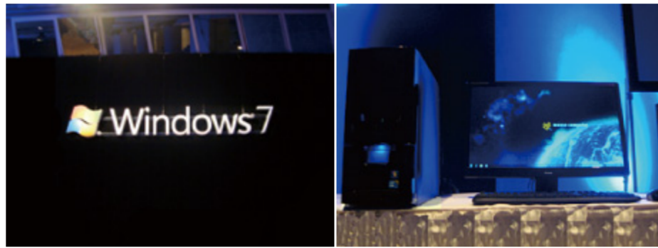
写真右：G-Tune NEXTGEAR、ProLite E2472HD-B

イベント会場は落ち着いたムードのブルーの照明でクールな印象でしたが、プレス関係者や一般ユーザーが多数来場され、会場はホットな活気に溢れていました。弊社からは、G-Tuneブランドから「NEXTGEAR」と、iiyamaブランドから「ProLite E2472HD-B」が展示されました。