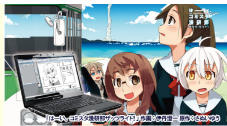
「はい、コミスタ漫研部ザツライ!」作画：伊丹澄一 原作：さめいゆう

撮影日は8月14日でしたが、この日は1日の来場者数過去最高の20万人を記録した日で、会場内ではどこも人であふれていました。