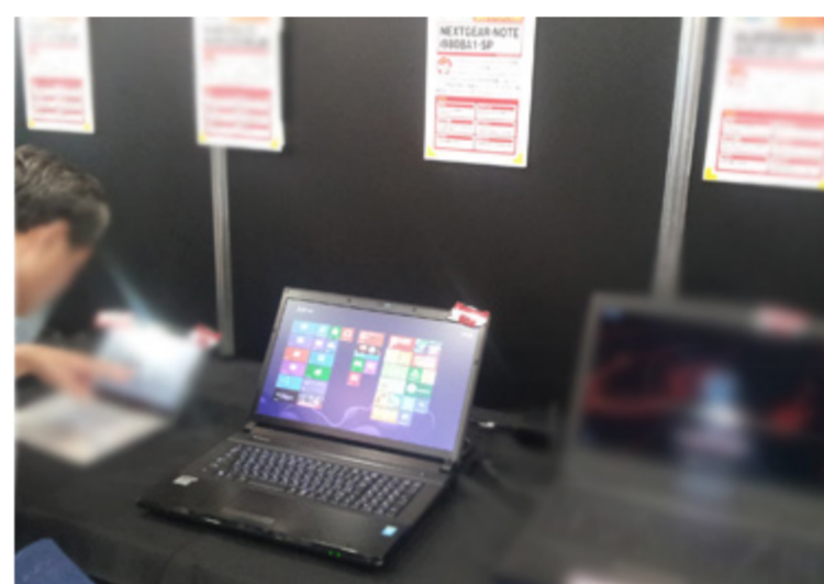
NEXTGEAR-NOTE i980シリーズ GTX780M搭載17.3型フルHDゲーミングノート